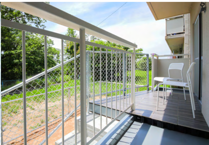
21-101 (1F) 庭付きリノベ45 家賃 54,000円