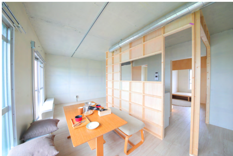
23-107(4F) ヨコニコイチ 家賃 78,000円