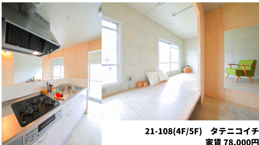
21-108(4F/5F) タテニコイチ 家賃 78,000円