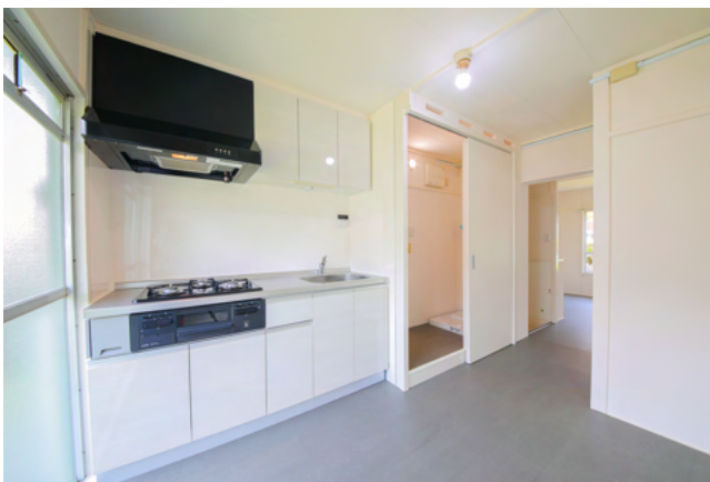
4-202 (1F) L+DR 家賃 47,000円

24棟集会所 駐車場をご用意しております。 27棟入口から警備員が誘導いたします。